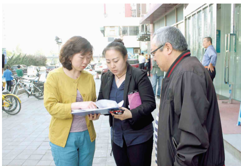
户信息 社区工作人员认真核对住