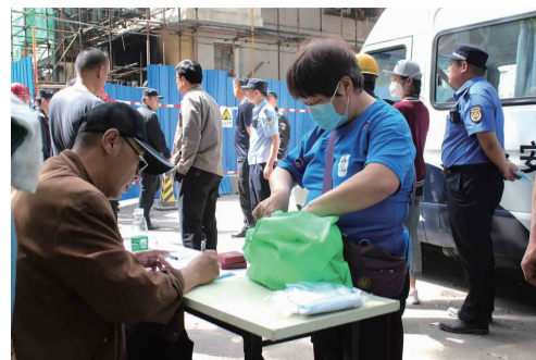
居民返家取物后登记物品信息