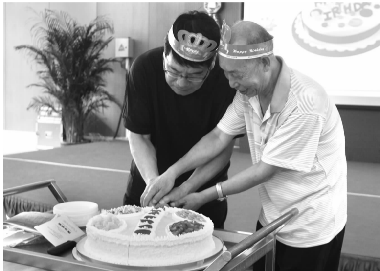
两位寿星共同切下生日蛋糕

原来,双井街道民生保障办公室每两个月就要举办一次像这样的生日宴,而生日宴的主角,正是无军籍退