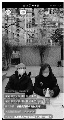
医生线上直播解答疑问