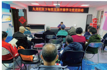
社区组织党员集中学习