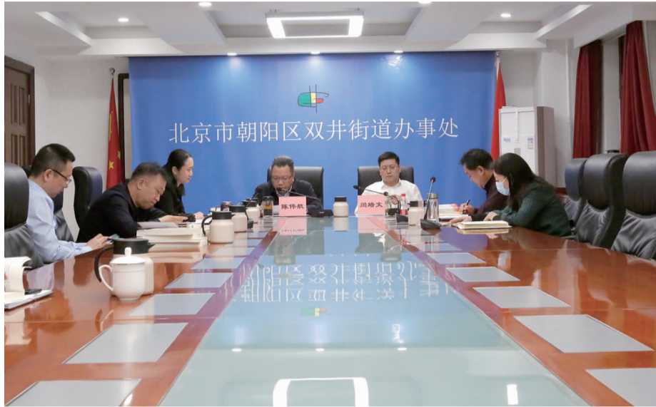
双井街道领导班子组织开展党史学习交流研讨