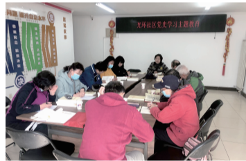
党员参加党史学习教育