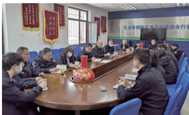
机关党支部学习党史