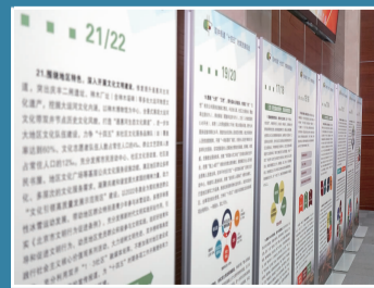
现场展板展示“十四五”规划