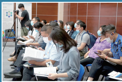
与会人员认真做好笔记