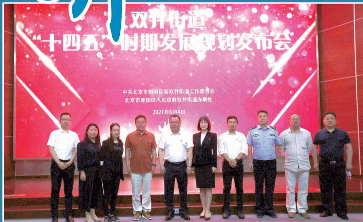
双井街道“十四五”时期发展规划会现场

下一步，双井街道将力求实现系统设计、整体推进、亮点突出、切实可行，将“十四五”规划与有关专项规划结合起来努力探索“井井有条”的城市治理模式，不断提升居民的获得感、安全感和幸福感，实现双井“十四五”规划的宏伟蓝图。