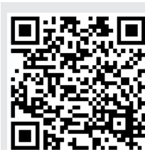
扫码听诗朗诵 《我亲爱的祖国》

周年,她也在用自己的声音诵读经典,为党庆生,并获得“诵读中华经典 献礼建党百年”主题诵读一等奖。在今年双井街道创享计划中,她提出了以趣味活动开展普通话练习的建议,得到专家评委的一直认可。后续,街道及社区也将开展相关活动,大力推广普通话。