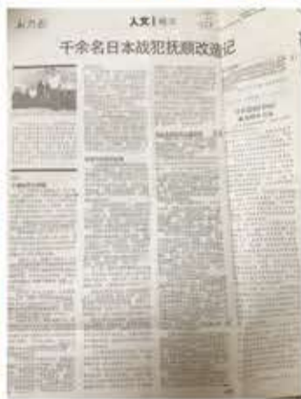
《新周报》关于日伪战犯的报道