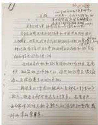
董玉梅关于审判日伪战犯的手写回忆稿