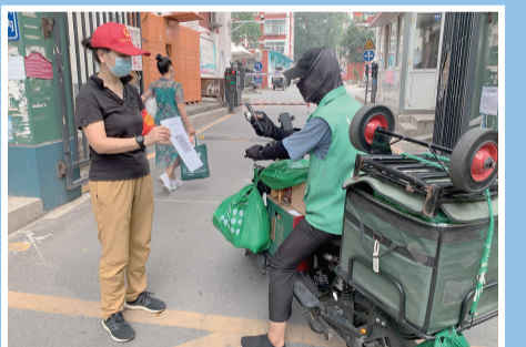
进社区请扫码登记