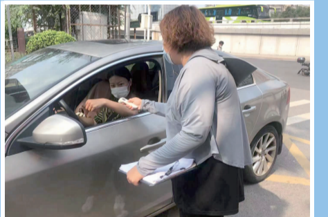
社区工作人员为过往人员测温