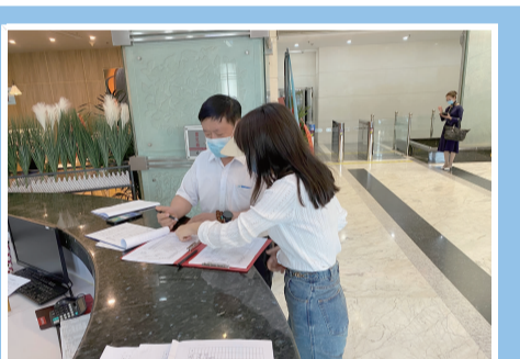
工作人员检查商务楼宇防疫工作

行程检查以及室内消杀等。督促企业做到严格高风险地区人员排查、严格人员出京管理、严格进楼人员管理“三个严格”,确保进入人员体温正常、佩戴口罩、健康码“绿码”,对于不规范不合格的情况要立即整改到位。要及时汇报异常情况,定期做好消杀并规范记录,坚决消除各类风险隐患,同时持续强化疫苗接种动员力度和疫情防控宣传力度,严格遵守从业人员接种疫苗后上岗,并按要求进行核酸检测,筑牢楼宇防控安全防线。