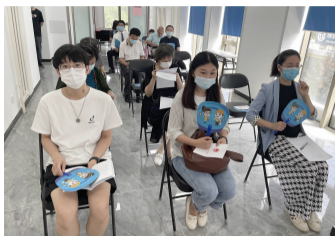
茂兴社区召开党支部会议