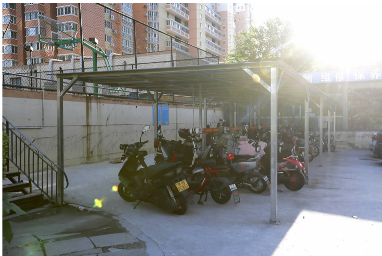
九龙山社区新建电动车棚