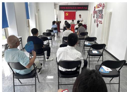
茂兴社区党员大会进行投票

学习,见证了历史重要时刻,留下了红色的印记和红色的文化资源。这次参观给我们上了一堂生动的党课,聆听祖国在中国共产党的领导下,从站起来,富起来,到强起来的光辉历史。同时,激励我们党员不忘初心、牢记使命的党性教育。没有革命先辈的努力就没有今天的幸福生活;没有华夏儿女的万众一心,就不能有这跨世纪的发展。我深感中国共产党的伟大,深深地体会到没有共产党就没有新中国。