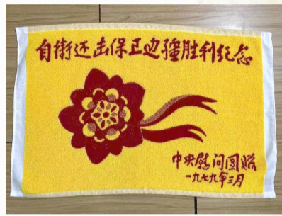
参加对越自卫反击战后颁发的慰问品