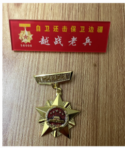
参加对越自卫反击战颁发的纪念章