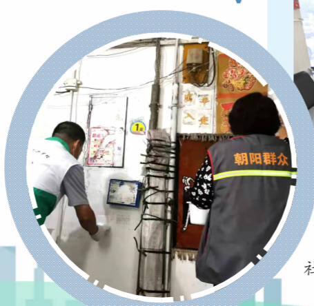
社工粉刷楼内小广告