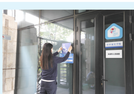
社工张贴无障碍指示牌