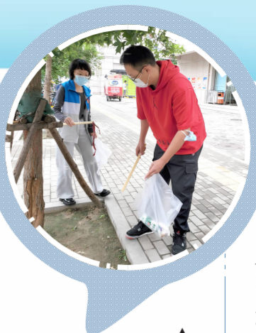
居民进行社区卫生大扫除

“以前我们也进行过粉刷,最近这些印章小广告又频繁出现。”社区工作人员说道。由于社区工作人员有限,许多居民志愿者也加入到粉刷队伍当中来,为了尽快完成,大家经常利用周末休息时间粉刷遮盖小广告。据了解,广外