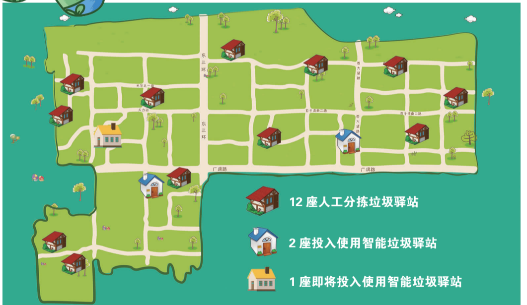
双井15座垃圾驿站点位图