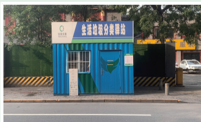
黄木厂社区垃圾驿站