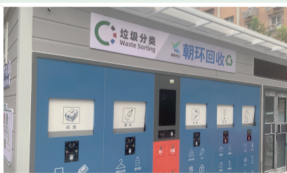
富力西社区新建智能垃圾驿站