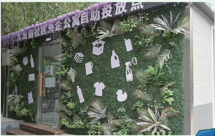
九龙南社区“智能+”垃圾驿站