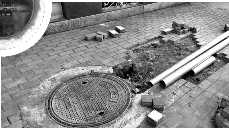
▲施工维修后恢复正常使用